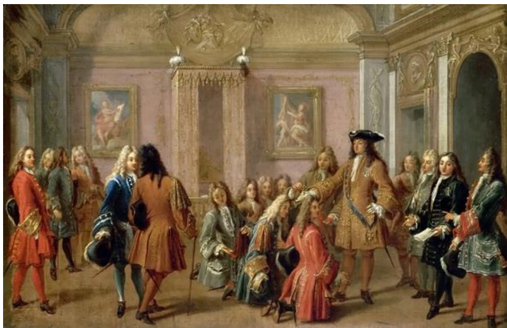
Одежда эпохи Людовика