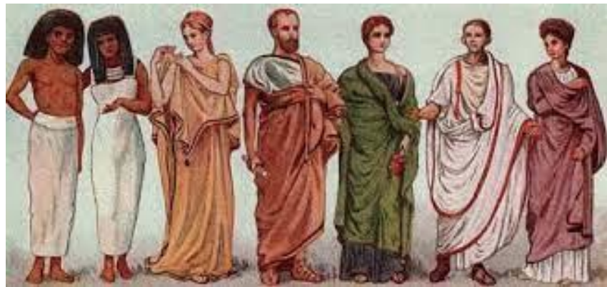
Одежда древних римлян и греков