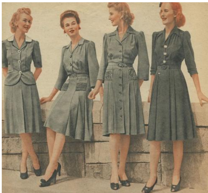
Одежда 40-х годов XX века

Вывод. Анализ образцов одежды разных исторических эпох показывает, что основные элементы костюмов утвердились уже несколько столетий назад. Последующее развитие одежды связано с появлением новых материалов, декоративных элементов и швейных технологий.