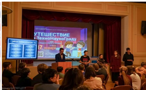
Участие учащихся объединения «Парапланеризм» в ежегодных мероприятиях СПБГЦДТТ в 2019-2020 годах