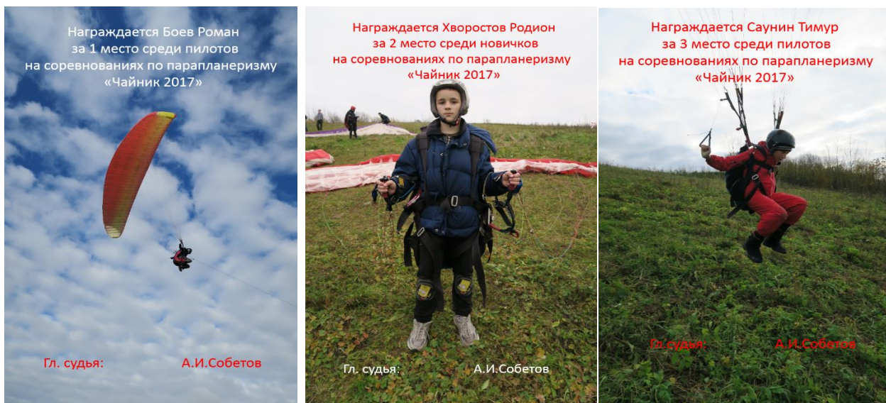
Соревнования «Чайник 2017» и образцы грамот

Каждый учащийся первого года обучения в объединении «Парашютизм» принимает участие в своих первых соревнованиях «Чайник». Это внутренние соревнования объединения, но очень значимые для ребят, так как показывают, как они освоили первичные навыки полета.