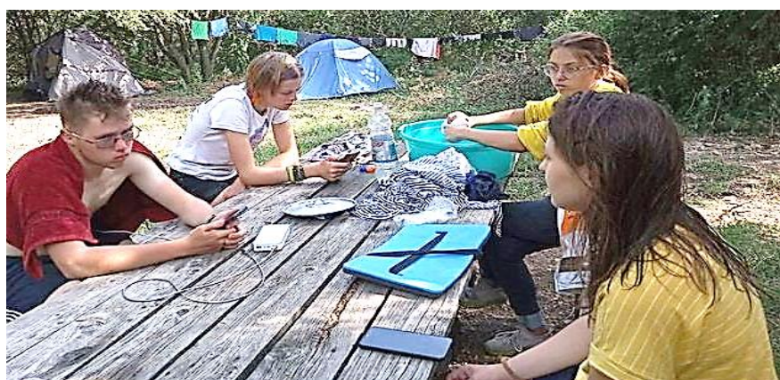
Свободное время в палаточном лагере на выезде на гору Юца

Учащиеся размещаются в поселке Юца Ставропольского края, где проживают в палаточном лагере. Каждый день проходят тренировки, а по завершению спортивных сборов лучшие из спортсменов участвуют в Первенстве России.