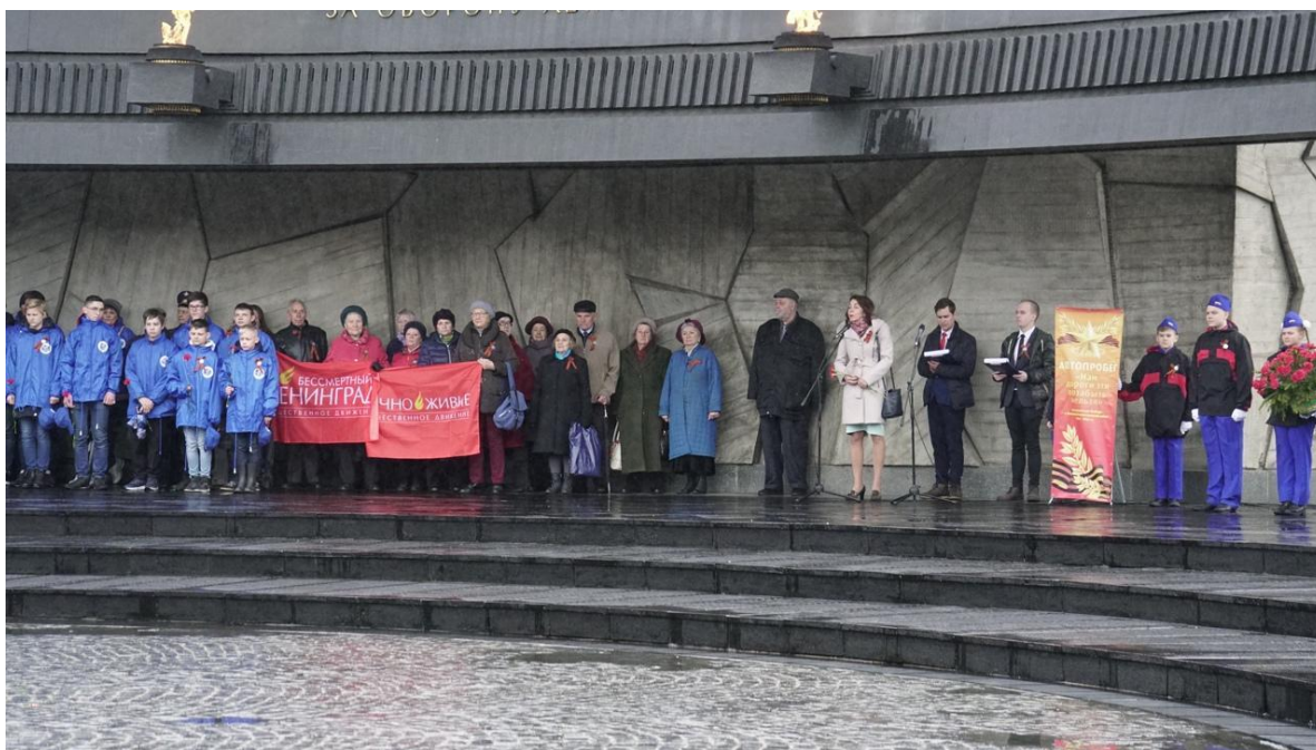
Участие воспитанников объединения в автопробеге «Нам дороги эти позабыть нельзя...». 2019 год

С целью создания условий для повышения гражданской ответственности за судьбу страны, воспитания гражданина, любящего свою Родину и семью, имеющего активную жизненную позицию, ребята принимают участие в системе мероприятий, направленных на формирование гражданско-патриотического воспитания подрастающего поколения: тематические кинолектории, «Эхо Блокады», автопробег «Нам дороги эти позабыть нельзя...», который посвящен Дню Победы советского народа в Великой Отечественной войне 1941-1945 годов.