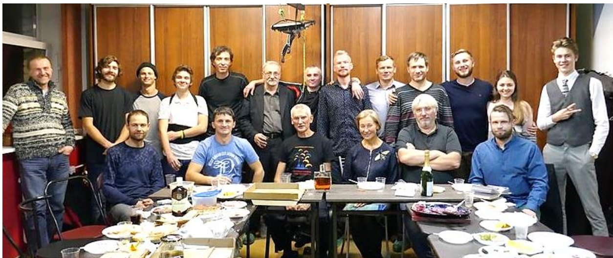
Встреча выпускников 2018 г.

Парапланеристы разных лет обучения – от самых юных до «ветеранов», закончивших свою учебу много лет назад, – собираются вместе. Всех нас объединяет любовь к небу, к свободному полету, и она сохраняется в душе навсегда.