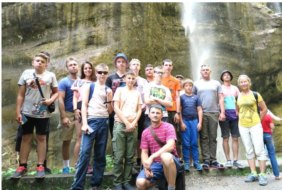
Экскурсии по Кавказским Минеральным Водам

Ежегодно выезжая на спортивные сборы, педагоги совмещают образовательный процесс с расширением кругозора своих воспитанников. Большое внимание уделяется разработке культурной программы выезда. Ребята посещают как природные, так и исторические достопримечательности Ставропольского края.