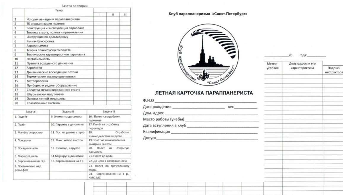
Образец «Летной карточки парашютиста»

Те из ребят, кто покажет хорошие результаты по карточке парашютиста, летом поедут в спортивный палаточный лагерь на Кавказ и там уже будут высокие полеты с 200 метровой горы Юца, парящие полеты на сотни метров вверх и десятки километров вдаль на Первенстве России.