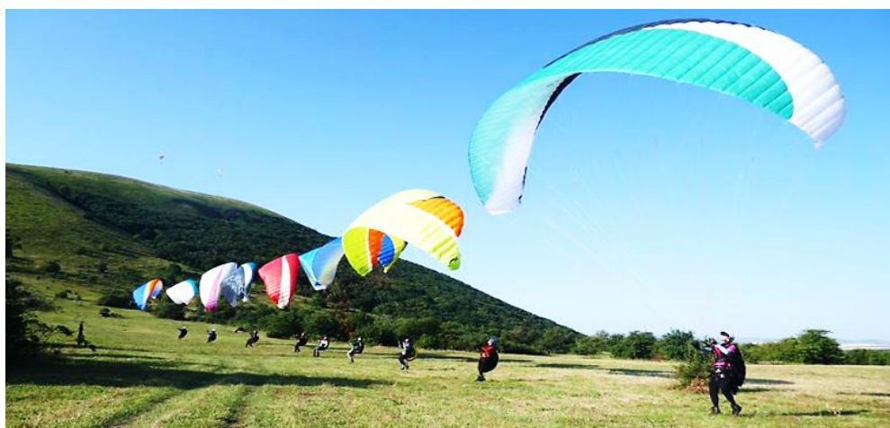
Тренировочный процесс на спортивных сборах

Каждое лето учащиеся объединения «Парапланеризм» на три недели выезжают в спортивный лагерь гору Юца в Ставропольском крае. В лагерь идет строгий отбор и в течение учебного года педагоги наблюдают за успехами юных парапланеристов. Учитываются результаты участия в соревнованиях разного уровня, работоспособность и активность ребят, уровень практических умений, показатели «Летной карточки парапланериста».