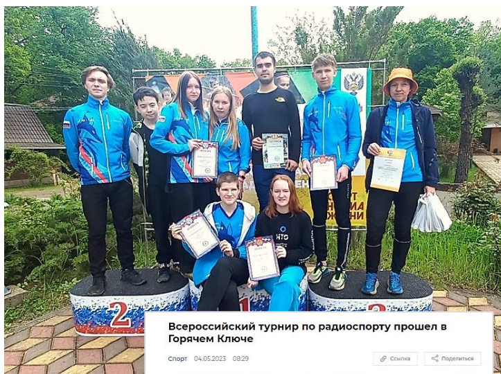
Всероссийский турнир по радиоспорту прошел в Горячем Ключе