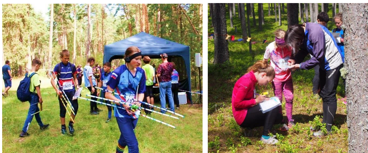
Рис.5. Работа команды