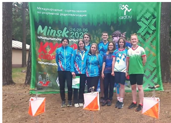
Рис. 7. Представители команды СПбГЦДТТ