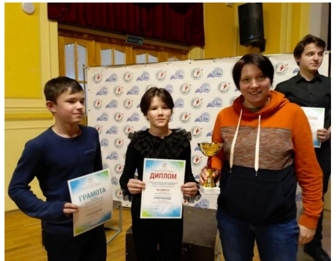
Рис.1. По итогам года Спартакиады по техническим видам спорта у команды 2 место!