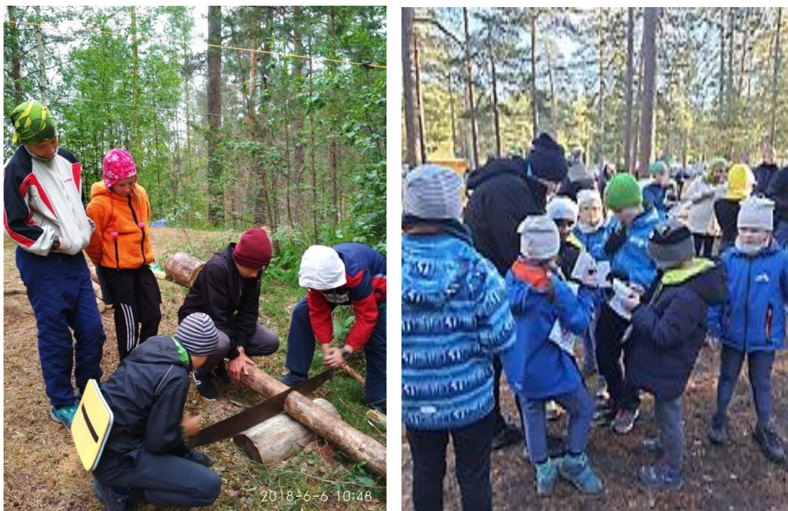
Рис.1. В течение процесса обучения у ребят формируются умение преодолевать трудности, работоспособность, дисциплинированность

• Прежде всего, преемственность в образовании обеспечивается при переходе от одной ступени обучения к другой с сохранением и постепенным усложнением содержания, форм, методов, технологий обучения и воспитания. Обучение детей каждой последующей ступени на основе системы преемственности, например, начало и конец учебного года, первый учебный год и второй, способствует пониманию механизма и особенностей спортивной радиопеленгации, развитию технико-тактических умений спортсменов - охотников, развивает у детей интерес в целом к техническому творчеству, стимулирует личность к познанию, обеспечивает тесную связь родителей и детей в учебном процессе, развивает гибкие навыки, формирует при этом традиции, на которых развивается личность. У ребят более интенсивно развивается память, мышление, чувства и воображение. К окончанию первого года и, тем более, второго года обучения более осознанными и волевыми становятся качества учащихся – умение преодолевать трудности, целеустремленность, выдержка, работоспособность, дисциплинированность. Эти качества, помогают ребятам быстро ориентироваться в новом материале, применять имеющиеся знания, хорошо усваивать трудные разделы в процессе обучения.