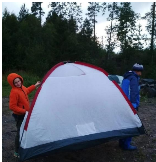
Рис.6. Ребята 2-го года обучения проводят инструктаж по сборке палатки для ребят 1 года обучения. На втором фото практическое применение полученных навыков в походе.