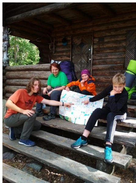
Рис.7. Инструктаж и помощь учащимся при совместной сборке байдарки родителями с детьми. Отработка трассы по карте. Май 2020 г.