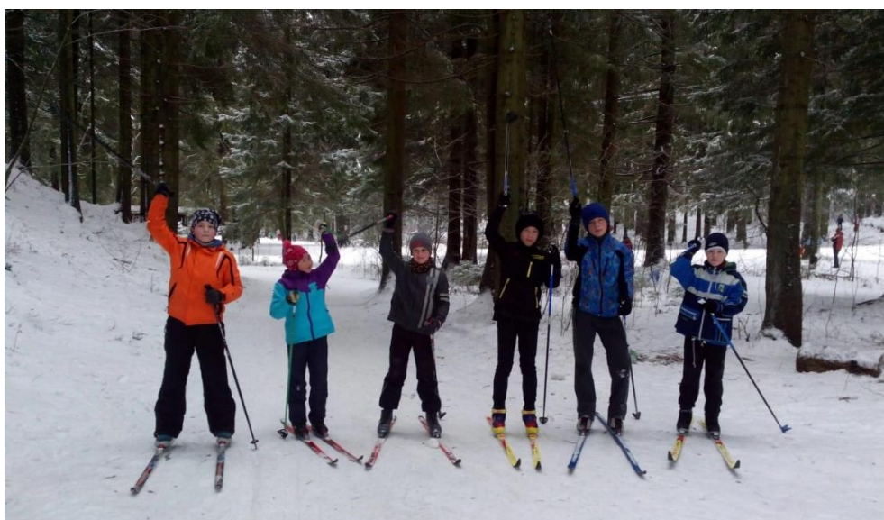
Рис.2. Совместная лыжная тренировка в Кавголово ребят 1 и 2 года обучения

• Принцип преемственности реализуется при включении учащихся первого года обучения в подготовку и организацию совместных спортивных и досуговых мероприятий с более старшими по уровню подготовки ребятами . Проведение совместных мероприятий с привлечением родителей в качестве помощников и равноправных участников является многолетней традицией объединения «Спортивная радиопеленгация и ориентирование».