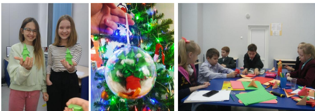
На фото: подготовка новогодних игрушек

В процессе обучения большую роль в сплочении коллектива играет общая работа. Она дает возможность ребенку принимать во внимание мнение, точку зрения других учащихся, соотносить средства интеллектуальной деятельности со своими личными интересами и мыслями. Взаимодействие, сотрудничество во время интеллектуальной активности, особенно групповой и коллективной проектной деятельности, приводит к развитию коммуникативности, коллективизма, креативности, критического мышления. Важно то, что при групповой организации процесс обучения прекращает быть объектом личностной активности и превращается в источник укрепления истинно коллективных действий.