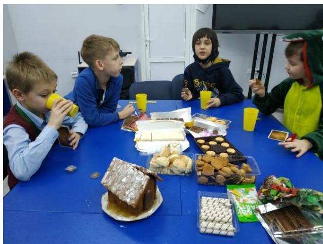
На фото: игровые дни на 8 марта и Новый год в 2022-2023 учебном году

Ежегодно, на Новый Год, ребята участвуют в конкурсе «Техническая Новогодняя Игрушка». По тематике объединения, используются 3D технологии, а именно развертки, которые можно напечатать и воссоздать компьютерную модель из бумаги. Этот процесс не очень сложен технически, но очень эффектен, в основном потому, что позволяет увидеть ребятам результат своей деятельности в реальности, а не только на экране. Позже, развертки публикуются и в социальных группах, так что и дома можно создать такую же игрушку.