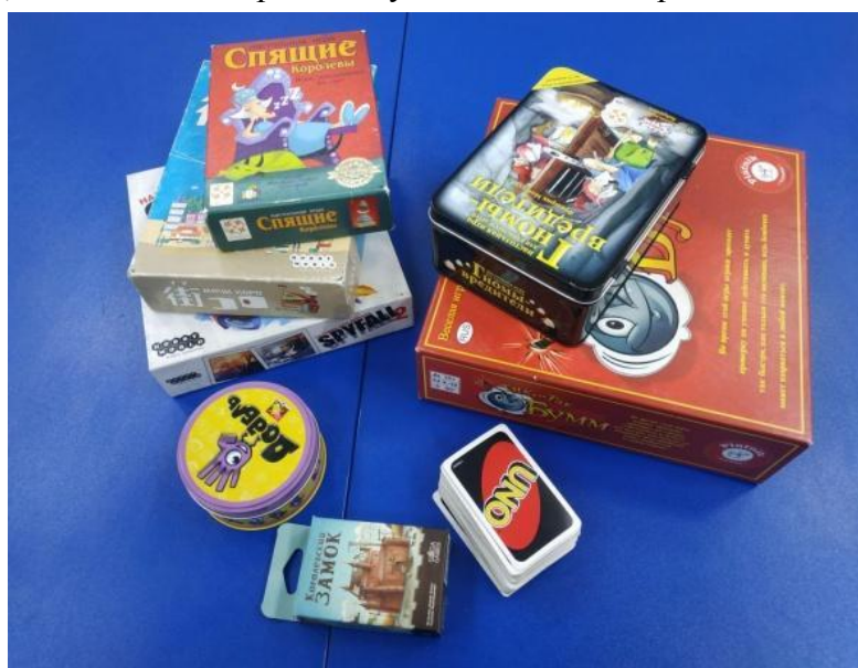
На фото: часть коллекции настольных игр объединения