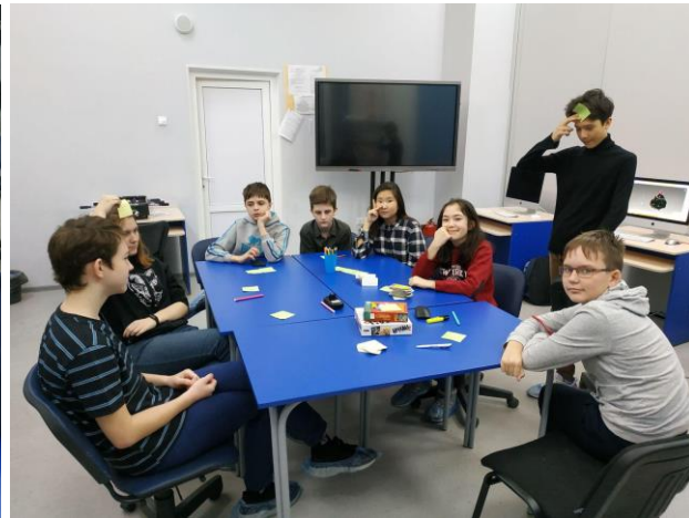
На фото: игровые перерывы в 2020-2023 учебных годах

В преддверии праздников в коллективе проходят игровые дни - мероприятия, когда на протяжении всего занятия ребята не работают, а играют. Зачастую вместе с играми происходит и чаепитие. Игры в эти дни подбираются особые, так как уже нет ограничения по времени. Это могут быть тематические игры, игры на ассоциации или же коллективные.