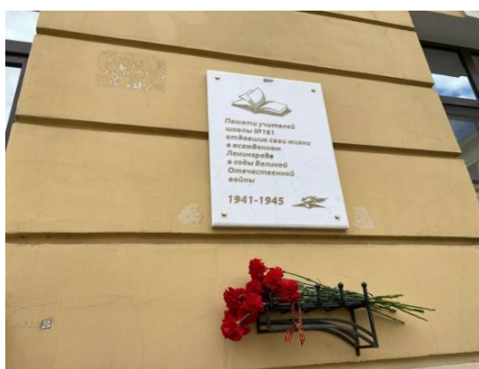
На фото: возложение цветов к доске памяти учителей блокадного Ленинграда