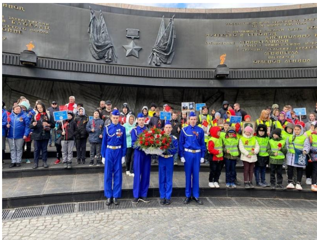
На фото: у монумента «Разорванное кольцо»