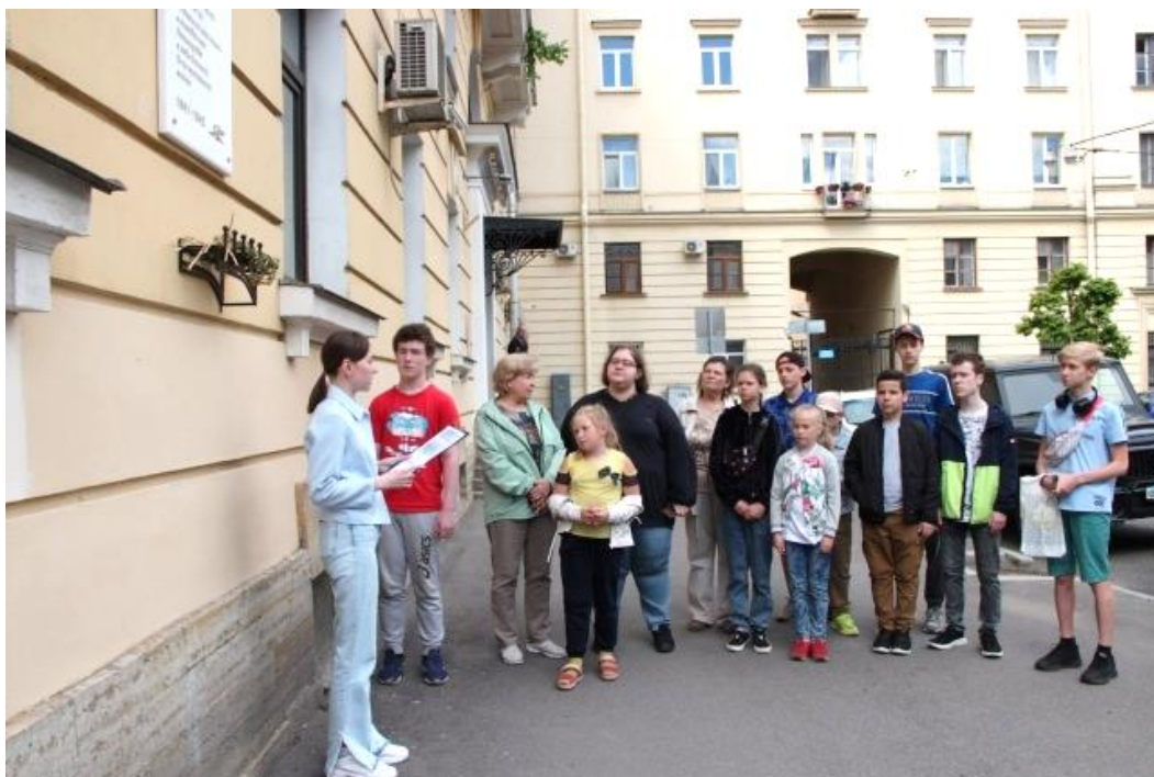
На фото: у мемориальной доски, посвящённой памяти учителей блокадного Ленинграда.

В День памяти и скорби учащиеся объединения возлагают цветы к мемориальной доске памяти учителей блокадного Ленинграда.