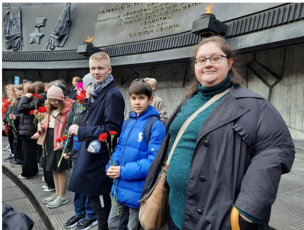
На фото: на возложении цветов у Монумента героическим защитникам Ленинграда

В канун празднования Дня Победы педагог с учащимися традиционно участвуют в памятном митинге, проводимом в рамках автопробега «На дороги эти позабыть нельзя...», и возложении цветов у Монумента героическим защитникам Ленинграда на пл. Победы.