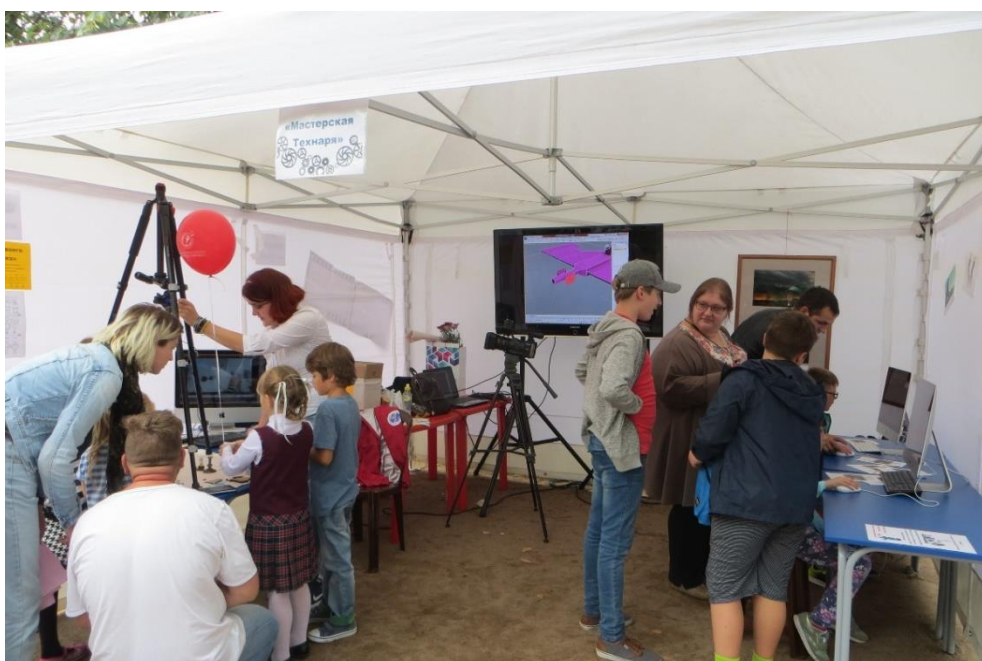
На фото: учащиеся объединения во время проведения мастер-класса «Мастерская Робота»

В качестве примера можно отметить участие детского коллектива в Городском празднике юных техников «Взгляд в будущее». Ребята помогают в проведении мастер-классов и представлении объединения на станциях отдела компьютерных технологий.