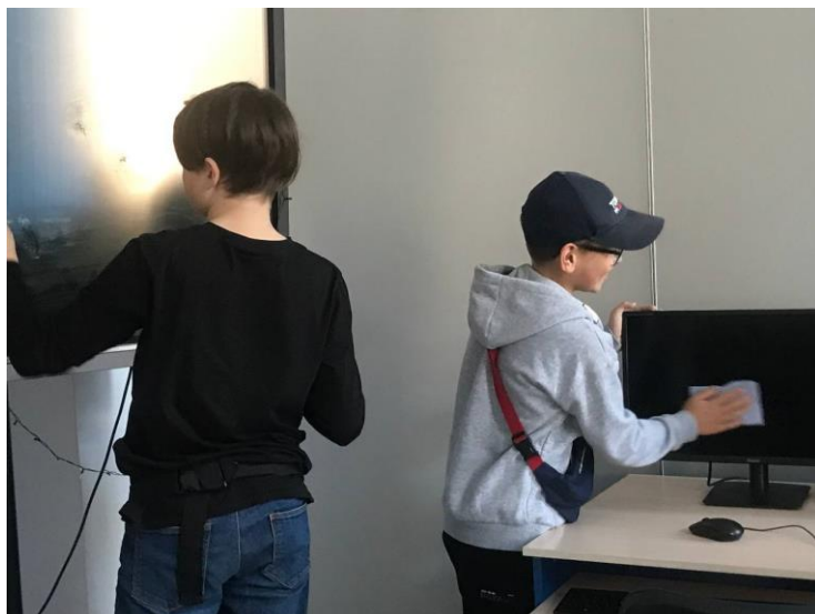
На фото: учащиеся объединения на субботнике

В канун празднования Дня Победы педагог с учащимися традиционно участвуют в памятном митинге, проводимом в рамках автопробега «На дороги эти позабыть нельзя...», и возложении цветов у Монумента героическим защитникам Ленинграда на пл. Победы.